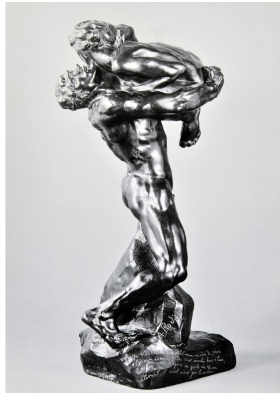
Abb. 1: Auguste Rodin: Ich bin schön , 1882, Bronze, 69,4 x 36 x 36 cm, Musée Rodin, Paris.

Als Beispiel zieht sie unter anderem Rodins Je suis belle (Abb. 1) heran. Schon in die Beschreibung der Skulptur fließt die Abgrenzung zu Vorherigem mit ein, um deutlich zu machen, mit welchen Sehgewohnheiten gebrochen würde: