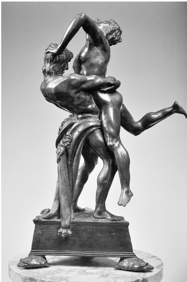
Abb. 2: Antonio des Pollaiuolo: Herkules und Antaeus , 1475, Bronze, 45 cm, Museo Nazionale des Bargello, Florenz.

Darüber hinaus ist der Beschreibung dieser Skulptur im Text die ausführliche Betrachtung eines dem Krauss’schen Modell entsprechenden Gegenparts vorangestellt. Mithilfe der Beschreibung der Klarheit und formalen Nachvollziehbarkeit von Antonio Pollaiuolos Hercules and Antaeus (Abb. 2) schafft Krauss eine weitere Abgrenzungsfolie: