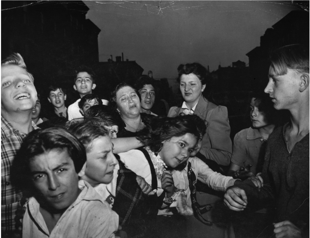
Abb.2: Weegee (Arthur Fellig): Their First Murder, 1941.

Indem das Bild des eigentlichen Geschehens hier erst an zweiter Stelle und deutlich kleiner gezeigt wird, findet eine Verschiebung statt, welche die Nachricht des Mordes nicht mehr einfach als Sensation zum Verkauf anbietet. Nun eröffnen sich auch neue Ebenen. Es sind zum einen die Blicke der durchaus als Publikum zu bezeichnenden Menge, die mit den unterschiedlichsten Emotionen auf den Toten sieht und gleichzeitig die Zeitungsläser*innen an ihren eigenen voyeuristischen Blick erinnert. Zur gleichen Zeit ist es auch der fotografische Blick, der hier reflektiert wird. Nicht nur Weegees Entscheidung sich um 180 Grad zu drehen und anstatt des Tatorts genau die andere Seite zu wählen und damit das Wesentliche letztendlich auszublenden macht den deutlich subjektiven Blickwinkel auf das Geschehen deutlich. Außerdem ist es hier auch ganz einfach seine physische Gestalt, die den Kindern sehr direkt im Weg steht. Indem sie unmittelbar in seine Kamera sehen oder versuchen an ihm vorbeizuschauen, wird er auf einmal präsent, während er sich trotzdem immer noch hinter dem Fotoapparat befindet. 19